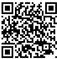
攜手桃花源 Youtube 頻道