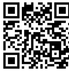
課程與教學 填報系統